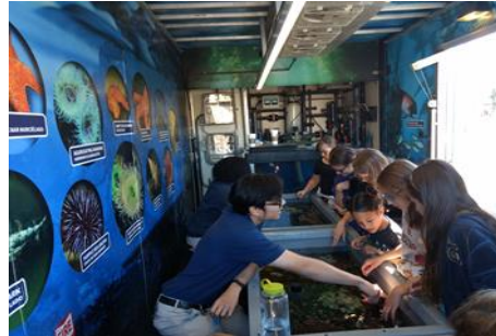
Acuario del Pacífico

Durante el año escolar PEAK ofrece cuidado de niños antes y después de la escuela en el plantel escolar, así como un programa de enriquecimiento después de la escuela. PEAK tiene un programa de verano dentro del plantel. Para mayor información llámeles al 661-219-5185